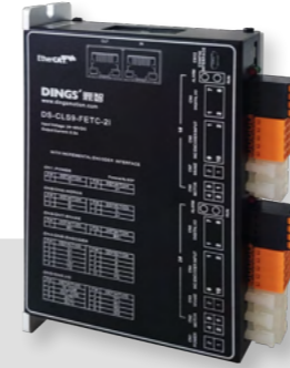
[ I=INC 엔코더 ] DS-CLS9-FETC-2I

EtherCAT 통신 제어, 지원 제어 모드 PP, PV, HM, PT / PP, PV, HM, CSP, CVS 모터 단락 보호, 저전압 보호, 과전압 보호, 과전류 보호 등의 기능 정밀한 제어로 저소음, 저진동 광절연 입력 기능