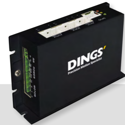
DS-BVS-FCAO / FETC