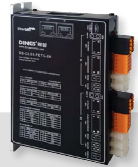
[ A=ABS 엔코더 / Biss-C type ] DS-CLS9-FETC-2A