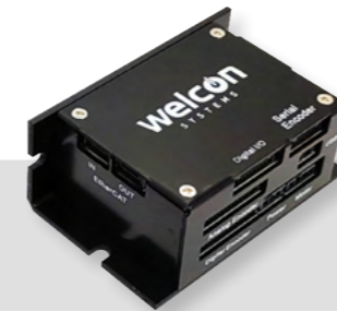
DS-BVM-FCAO / FETC

BLDC 및 보이스코일 모터 전용 Closed Loop 드라이브 드라이브와 모션 제어에 대한 CiA 301 적용 레이어 및 CiA 402 디바이스 프로파일 DINGS' SERVO STUDIO를 통한 오토 튜닝 및 다양한 파라미터 설정 가능 CANopen 및 EtherCAT 통신 지원 위치, 속도, 토크 제어